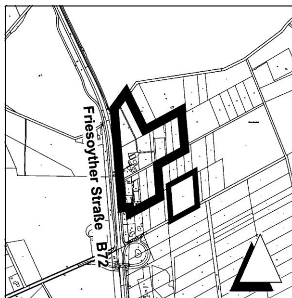
Geltungsbereich Flächennutzungsplanänderung Nr. 1.06